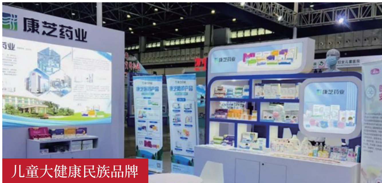
儿童大健康民族品牌