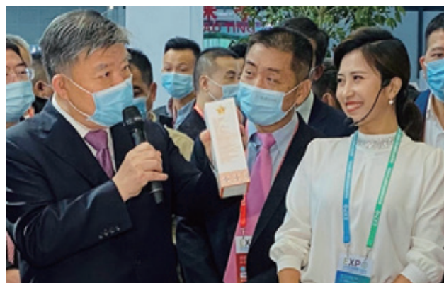
全国人大常委会副委员长陈竺一行莅临展馆考察指导

本次参展，不仅让大众深入了解康芝产品的“硬实力”，也预示着康芝向世界舞台又迈出了坚实的一步。未来，康芝将继续以“诚善行药，福泽人类”为己任，积极践行“儿童大健康战略”和“精品战略”，秉持“真诚、关爱、创新”的企业精神，专注安全、有效的儿童药物研发，匠心打造儿童大健康产业的民族品牌，做先进科技应用于儿童健康产品与服务领域的先行者，做儿童健康生活、健康成长的推动者和守护者。