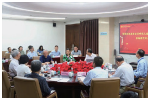
基于真实世界研究的儿童药物研发策略与技术专家研讨会

2021年4月12日，由世界中医药学会联合会真实世界研究专业委员会与康芝药业联合主办的“基于真实世界研究的儿童药物研发策略与技术专家研讨会”在康芝药业海南总厂隆重召开，多位行业大咖专家齐聚一堂，共同探讨儿童群体用药安全保障等议题探讨儿童药物研发现状和基于真实世界研究的儿童药物研发的未来发展方向。